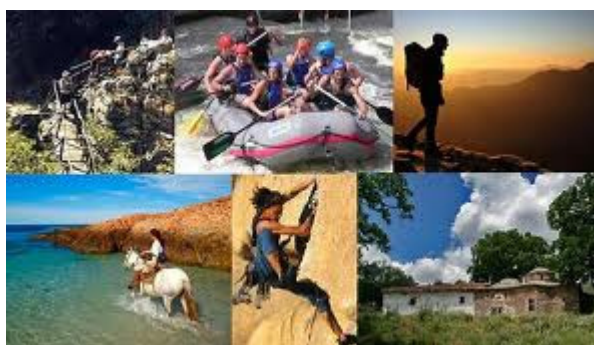
Πίνακας 1.1: «Ειδικές Μορφές Τουρισμού»

Βέβαια αυστηρός ορισμός στις συμβατικές και τις εναλλακτικές μορφές τουρισμού είναι δύσκολο να δοθεί. Μια δραστηριότητα που με βάση το είδος και το περιεχόμενό της θεωρείται εναλλακτική μπορεί, υπό προϋποθέσεις να είναι συμβατική και το αντίστροφο. Συνήθως ο όρος Συμβατικές μορφές ταυτίζεται με τουριστικές δραστηριότητες των οποίων το περιεχόμενο να βασίζεται στο μοντέλο 3S(sea, sun, sand), δηλαδή με τις διακοπές σε παραθεριστικά θέρετρα, αλλά μπορεί να καθορίζεται κι από τις συνήθειες των τουριστών σε μια συγκεκριμένη χρονική περίοδο και σε συγκεκριμένη περιοχή. Ο όρος Εναλλακτικές μορφές από την άλλη απευθύνεται σε εξειδικευμένα τουριστικά ενδιαφέροντα και περιλαμβάνει ειδικές μορφές τουρισμού όπως ο οικοτουρισμός, ο αγροτουρισμός, ο συνεδριακός, ο πολιτιστικός τουρισμός κ.α (βλ πίνακα 1.1 ). Μερικά από τα βασικά χαρακτηριστικά του εναλλακτικού τουρισμού είναι η εξειδικευμένη και εξατομικευμένη τουριστική ανάπτυξη σε συνδυασμό με μια μορφή ταξιδιού, φιλικής προς το περιβάλλον, επιτρέποντας θετικές κοινωνικές αλληλεπιδράσεις και από κοινού βιώματα μεταξύ μελών διαφορετικών κοινωνιών.